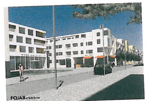
TORGET OCH TORGGATAN