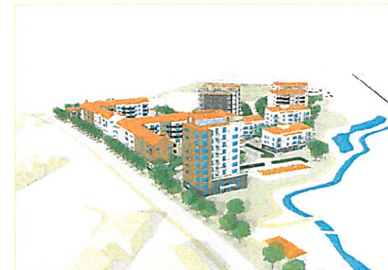
SEGESTRAND SETT FRÅN VÄSTER