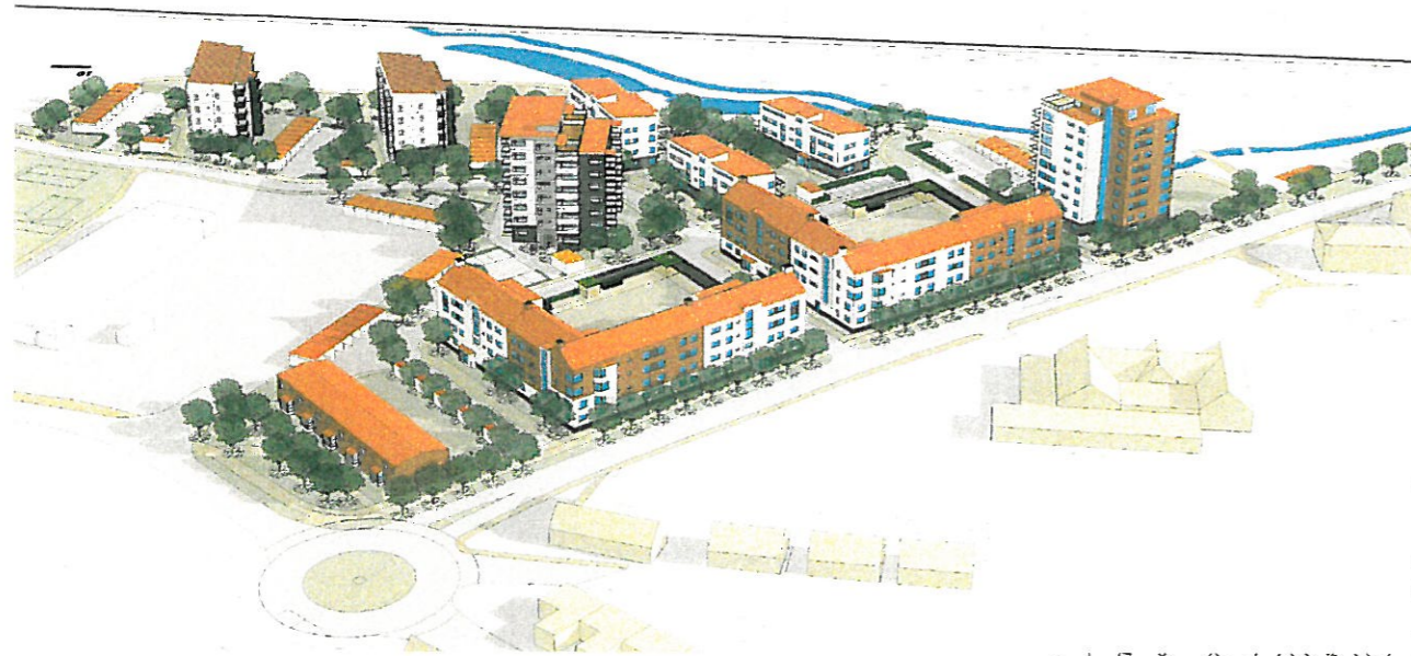
VY ÖVER SEGESTRAND NORRIFRÅN