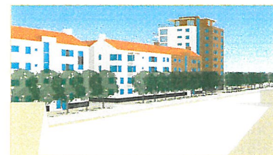
JÄRNVÄGSGATAN FRÅN NORR