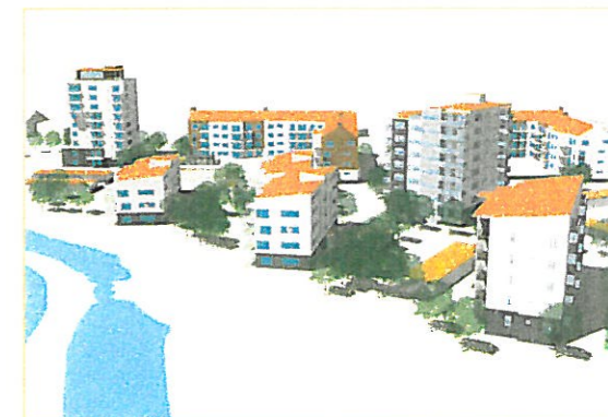
VY FRÅN SYDOST