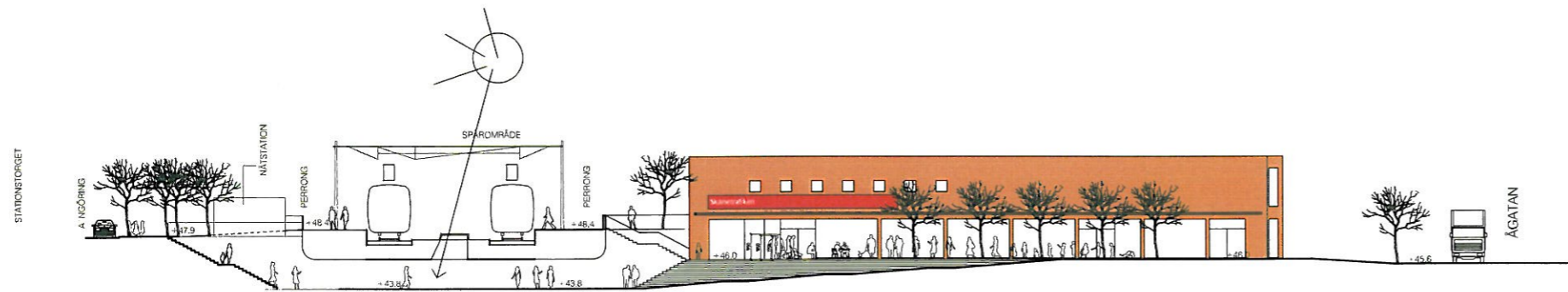
SEKTION / FASAD MOT ÖSTER GENOM STATIONSOMRÅDET